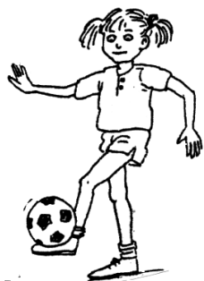
Singelloop op 20 april 2012